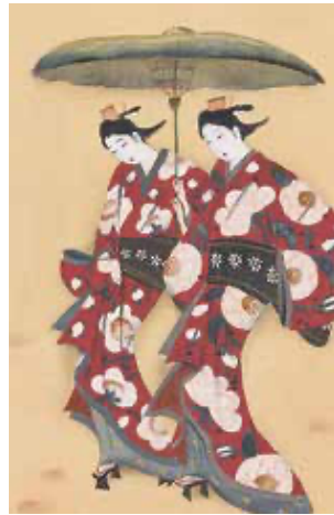
《小唄十二月 卯月》(部分) 1922年