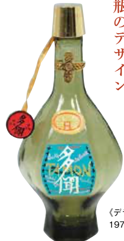
《デラックス多聞》 1971年頃