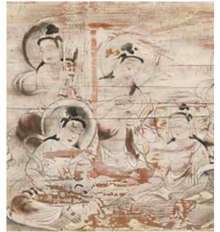
《薬師浄土(富貴寺本堂壁画)》(部分) 1930年